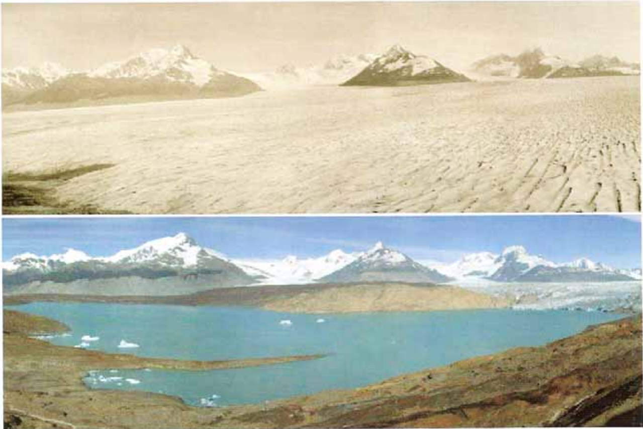
ภาพเปรียบเทียบการละลายของธารน้ำแข็งในพาดาลโกเนีย ประเทศอาร์เจนตินา ใน ปี ค.ศ. 1928 (บน) และ 2004 (ล่าง)