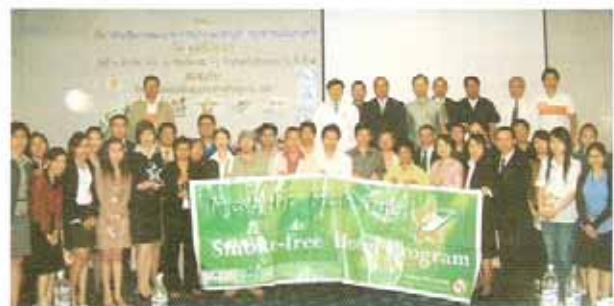
วันที่ 14 มีนาคม 2550 ณ โรงแรมเชียงใหม่ คองคันทัน จังหวัดเชียงใหม่

มูลนิธิไบนี่เขียว โดยการสนับสนุนของสำนักงานกองทุนสนับสนุนการสร้างเสริมสุขภาพ จัดสัมมนาสัญญาณโครงการโรงแรมปลอดบุหรี่ เพื่อให้โรงแรมสามารถสร้างความประทับใจแก่ผู้ให้บริการ ครอบคลุมคุณภาพ สะดวก รวดเร็ว เอาใจใส่รายละเอียดความต้องการเฉพาะของผู้ใช้บริการ อบอุ่น มีประสิทธิภาพ และมีสุขลักษณะที่ดี การพักผ่อนที่มีคุณภาพ และความรู้ความเข้าใจดังกล่าวเป็นส่วนสำคัญของความต้องการและความคาดหวังที่จะให้โรงแรมพัฒนาคุณภาพการบริการ ให้ได้ทันกับกระแสการเปลี่ยนแปลงโดยเฉพาะด้านอาหารและสุขภาพ