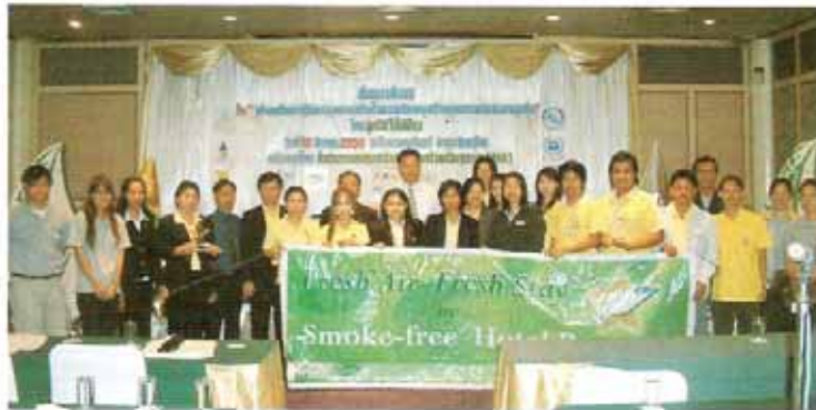
วันที่ 12 มีนาคม 2550 ณ โรงแรมอินริทรี ธานี จังหวัดพิษณุโลก