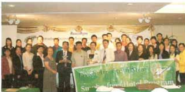
วันที่ 13 มีนาคม 2550 ณ โรงแรมดุสิต โฮเทลล์ โกลด์ จังหวัดเชียงใหม่