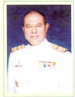
นายแพทย์มงคล ณ สงขลา รัฐมนตรีว่าการกระทรวงสาธารณสุข

การดำเนินการตามประกาศกระทรวงสาธารณสุข ฉบับที่ 17 พ.ศ. 2549 เรื่อง กำหนดสถานที่ห้ามสูบบุหรี่ในที่สาธารณะ พร้อมทั้งออกกรมรณรงค์ติดป้ายเขตปลอดบุหรี่ ที่สถานีรถไฟกรุงเทพ (หัวลำโพง) ประกาศกระทรวงสาธารณสุข ฉบับที่ 17 เป็นการกำหนดพื้นที่ที่ต้องจัดเป็นเขตปลอดบุหรี่เพิ่มขึ้นจากเดิม โดยเริ่มมีผลบังคับใช้ตั้งแต่วันที่ 29 ธันวาคม 2549 เป็นต้นไป ซึ่งเรื่องพื้นที่ปลอดบุหรี่นี้ ต้องอาศัยความร่วมมืออย่างมากจากหน่วยงานต่างๆ ที่เกี่ยวข้อง ช่วยกันดูแลให้มีการดำเนินการตามกฎหมายอย่างเคร่งครัด