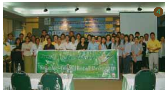
1 โรงแรมสร้างเสริมสุขภาพ แวดล้อมด้วยต้นไม้ใหญ่ เพิ่มอากาศบริสุทธิ์ 2 ขอแสดงความยินดีกับโรงแรมปลอดบุหรี่ 220 โรงแรม 3 ห้องรับประทานอาหาร หนึ่งในพื้นที่ปลอดบุหรี่ภายในโรงแรม 4 กิจกรรมสัมมนาสัญจร “โรงแรมปลอดบุหรี่”